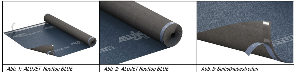
Abb. 1: ALUJET Rooftop BLUE