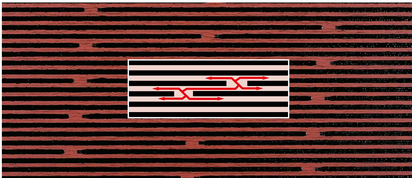
Dauerhafter Dampfdruckausgleich durch unterbrochenes Power-Therm-Profil

Der Nahtstreifen auf der Oberseite der Bahn ist mit dem gleichen verlegefreundlichen Spezialbitumen belegt wie auf der Unterseite. Die Cut-Lines (feine Längsschnitte in der Nahtfolie) verhindern flächige Folienreste im Nahtbereich, die Kapillare bilden könnten. Ein homogener Nahtverbund ist somit sichergestellt.