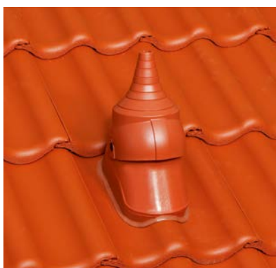
DuroVent Premium Antennendurchgang