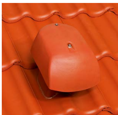
DuroVent Premium Lüfter DN 160