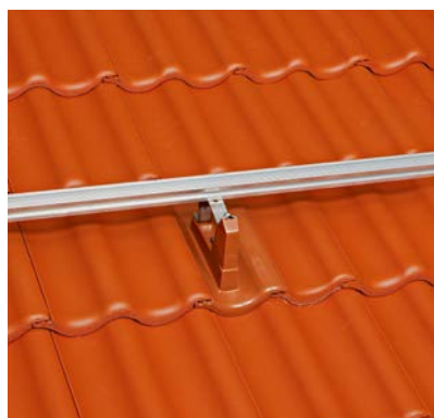
Modulstütze inkl. Grundpfanne (ETA zugelassen)