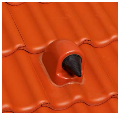
DuroVent Premium Solar-/Kabeldurchgang