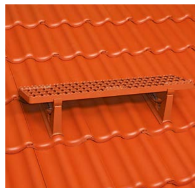
Standstein, Bügel und Sicherheitsrost