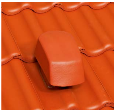
DuroVent Premium Sanilüfter

Alles, was beim Dach on top kommt, passt farblich hervorragend zu den Dachsteinen. Denn wir entwickeln das komplette Dach im System. Alles passgenau, überwiegend materialgleich und optisch aufeinander abgestimmt. Alles in Deutschland produziert. Wir verwenden nur hochwertige, langzeiterprobte Materialien, die ihre Wetterbeständigkeit und Dauerhaftigkeit bewiesen haben.