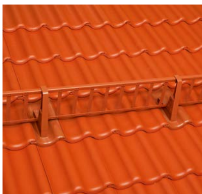
Schneefanggitter und -stütze