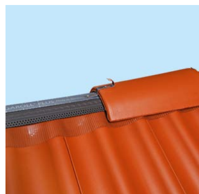
Firststein, Firstklammer und Figaroll Plus