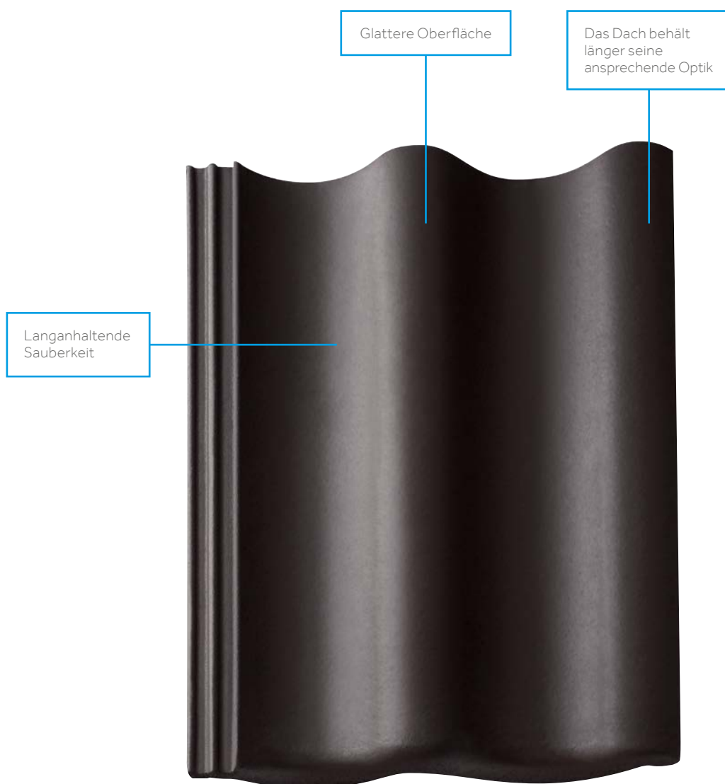
Harzer Pfanne Star (Matt), Granit

Ein schickes Upgrade für Ihr Dach. Die Harzer Pfanne gibt es jetzt serienmäßig eine Qualitätsstufe höher: in Star-Qualität mit schmutzabweisender Oberflächenveredelung. So ist Ihr Dach auch nach Jahren noch ein echter Hingucker.