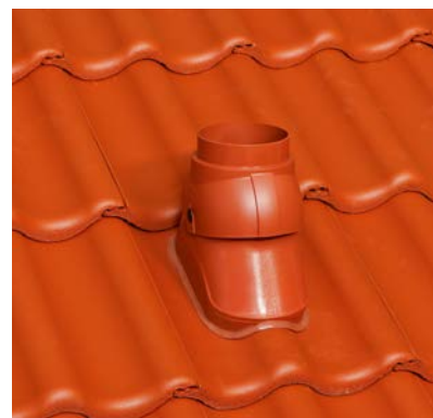
DuroVent Premium Abgasrohr-Durchgang