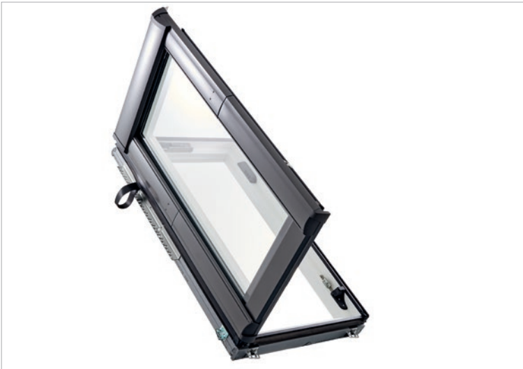
Bild zeigt Flügelanschlag rechts von innen gesehen.